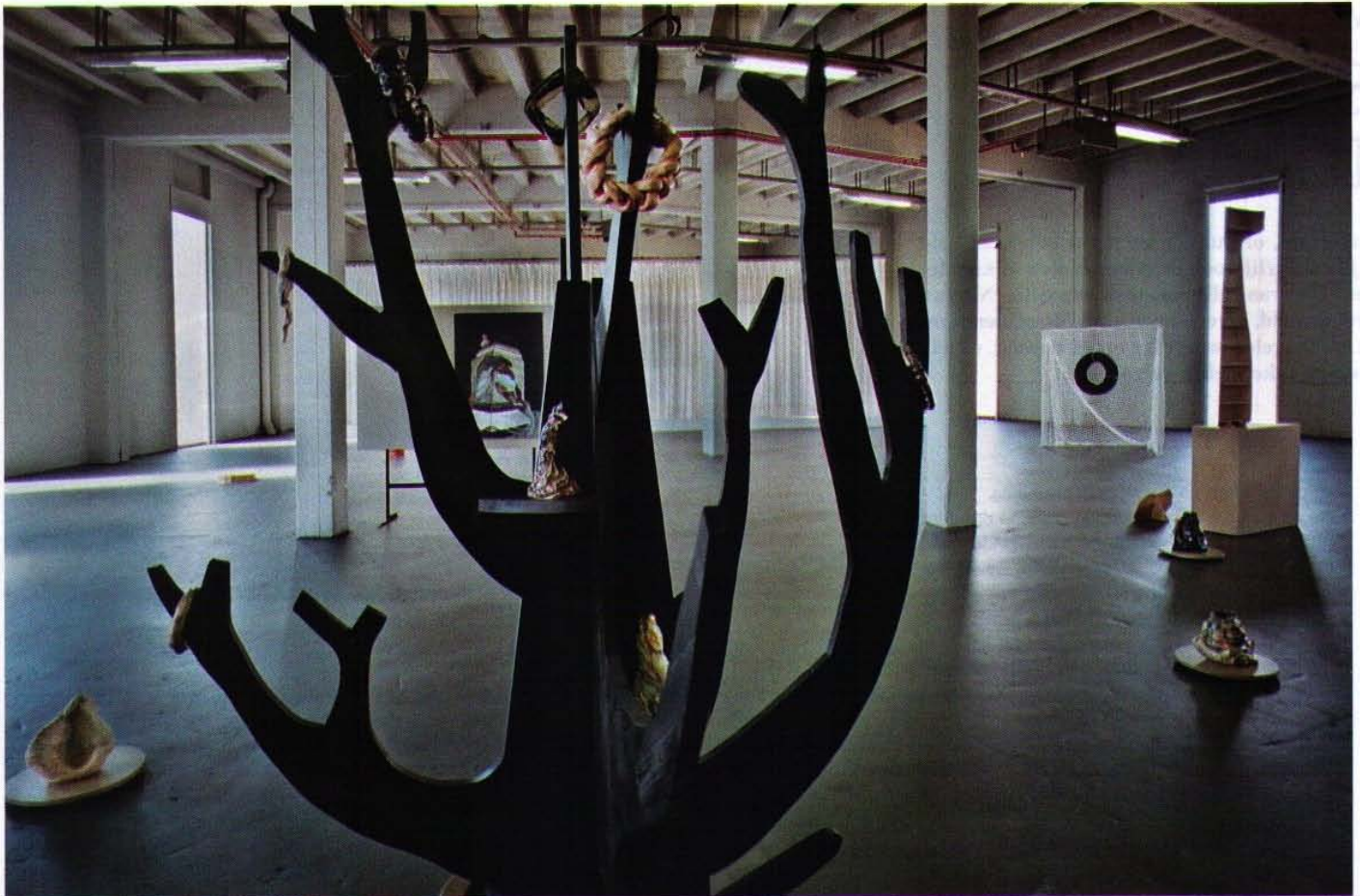
VALÉRIE MANNAERTS IN EXTRA CITY, ZAALZICHT