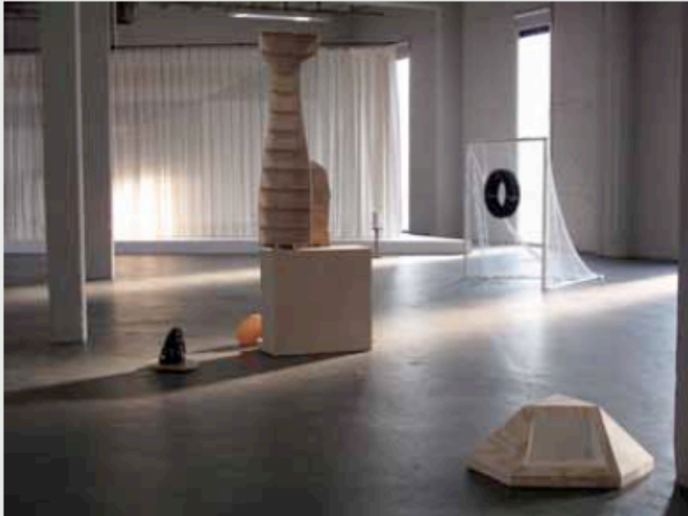
Valérie Mannaerts: Blood Flow, installation view, Extra City 2010

Met diverse materialen als hout, brons, keramiek, textiel, verf, papier-maché en papier creëerde Mannaerts voor deze tentoonstelling hybride, weerbarstige en dubieuze vormen die enerzijds ontvankelijk zijn voor toevalligheden, maar anderzijds toch duidelijk formeel zijn omschreven. Haar werk tast de grens af tussen beeld en object, tussen organische en anorganische vormen. De installatie doet denken aan een surrealistische sculpturentuin die de hele tentoonstellingsruimte van Extra City omvat. De opstelling van haar werken trekt de bezoeker mee in haar fascinerende wereld waar, zoals in het theater, de scenografie de leiding neemt. Tussen de gedefinieerde en ongedefinieerde vorm, tussen het ongewone en vertrouwde ontstaat een unieke en eigenzinnig geformuleerde vormtaal die uitnodigt tot een imaginaire reis.